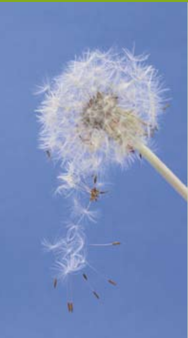
Manche Menschen reagieren auf verschiedene harmlose Stoffe mit massiven Abwehrreaktionen.

Allergien gehören zu den häufigsten Erkrankungen überhaupt. Es handelt sich dabei um eine Fehlfunktion des Immunsystems. Die körpereigenen Abwehrkräfte wenden sich gegen eine im Grunde harmlose Substanz (z. B. Pollen oder Bienenstiche) und lösen dadurch eine allergische Reaktion aus. In seltenen Fällen können diese Fehlfunktionen auch lebensbedrohlich sein (z. B. bei