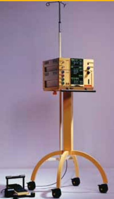
Die neueste Entwicklung auf dem Gebiet der Katarakt- und Netzhautchirurgie.

Die Abteilung für Augenheilkunde in der Privatklinik Hochrum bedient nahezu alle Gebiete der konservativen und operativen Augenheilkunde. In den letzten Jahren erzielte die medizinische Forschung auf diesem Gebiet große Fortschritte. Genauere Diagnoseverfahren und neue Behandlungsmethoden helfen bei der frühzeitigen Erkennung und Heilung oder zumindest bei der Linderung vieler Augenleiden.