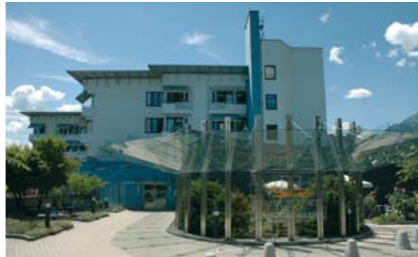
Werbeagenturen COMdesign & Duschek, Seefeld, Innsbruck

Ein Team aus erfahrenen Ärzten und engagierten Krankenschwestern und -pflegern, das auf modernste medizintechnische Einrichtungen zurückgreifen kann, sorgt sich um das Wohl seiner Patienten. Große, freundliche Zimmer und diverse Annehmlichkeiten, wie Hallenbad und Cafeteria, unterstützen eine rasche Genesung.