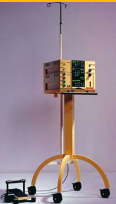
Die neueste Entwicklung auf dem Gebiet der Katarakt- und Netzhautchirurgie.

Die Abteilung für Augenheilkunde in der Privatklinik Hochrum bedient nahezu alle Gebiete der konservativen und operativen Augenheilkunde. In den letzten Jahren erzielte die medizinische Forschung auf diesem Gebiet große Fortschritte. Genauere Diagnoseverfahren und neue Behandlungsmethoden helfen bei der frühzeitigen Erkennung und Heilung oder zumindest bei der Linderung vieler Augenleiden.