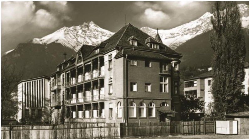
Das Haus St. Elisabeth überstand den Zweiten Weltkrieg fast unbeschadet.

Anfang der 30er Jahre bauten die Kreuzschwestern eifrig weiter an ihrem Sanatorium, nach wie vor beheimatet in der Kaiserjägerstraße. Nach dem Aufbau des Westtraktes über der Küche erfolgte 1932 der komplette Einbau einer Röntgenstation. Das Jahr 1935 machte es notwendig, Operationsräume, die Kanzlei – zwischen den beiden Flügeln des Sanatoriums – und auch einen Lift einzubauen.