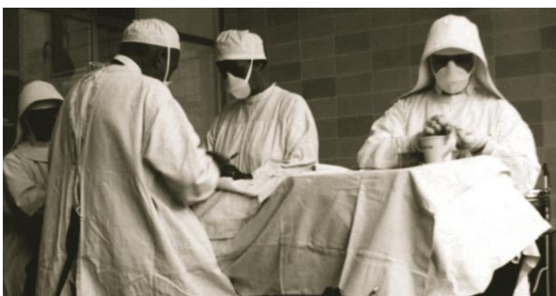
Eine schwere Operation kurz nach dem Krieg.

Ab dem Jahre 1949 begann schließlich die Generalsanierung des in den Jahren 05-06 erbauten Sanatoriumsgebäudes. Nicht nur erhielten alle Zimmer Kalt- und Warmfließwasser, auch wurde dem Wunsch der Patienten nach einem Zimmertelefon Rechnung getragen. Die Badeanlage im Tiefparterre wurde für medizinische Bäder umgebaut und ein moderner Speiselifth wurde installiert, die an der Straße gelegene Armenstube in die Nähe der Küche verlegt.